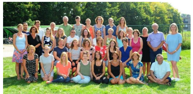
'Het Rozenkransteam 2017-2018'

Lees deze nieuwsbrief ook op www.rozenkransschool.be